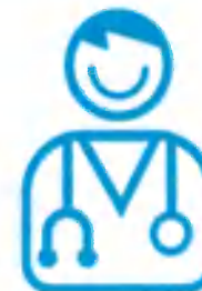
Kinésithérapeutes Educateurs sportifs