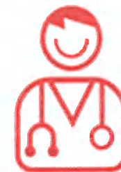
Infirmières IDE Addictologie Cadre de Santé